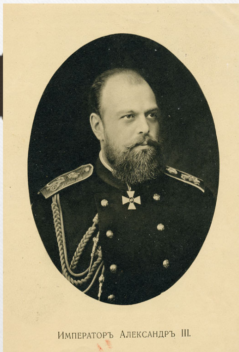
ИМПЕРАТОРЪ АЛЕКСАНДРЪ III.